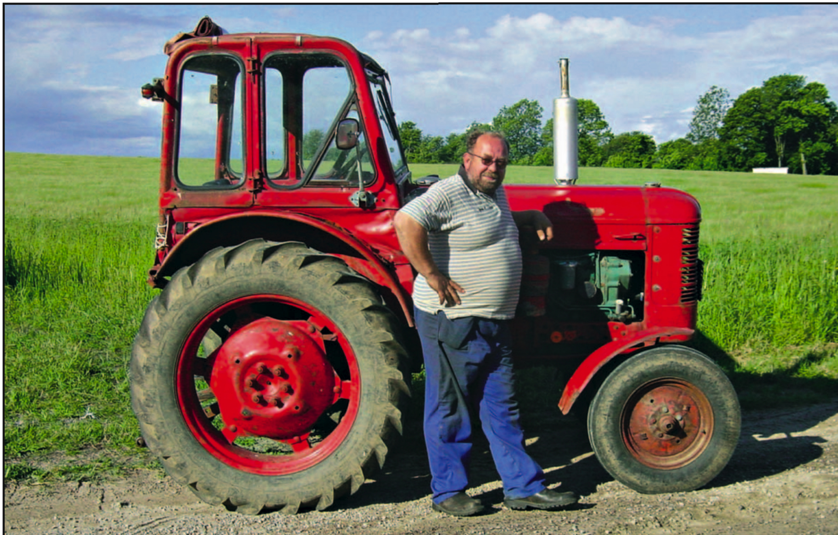
Traktormusikk: To museer fikk 50 000 kroner i støtte av Norsk Kulturråd til å oppføre en konsert med tolv traktorer fra 50- og 60-tallet.

Hvert år brukes millioner av skatte kroner på kunstprosjekter som det du ser her – en bonde og hans dieseltraktor. ►