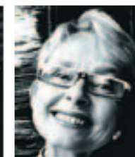
Vigdis Moe Skarstein, kulturrådsleder.